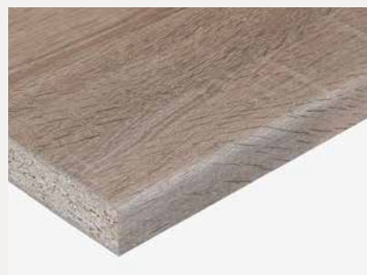
3156 SC Sawcut Eik