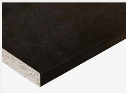
1049 Q Svart Trento