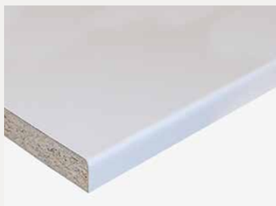
810 P Risør